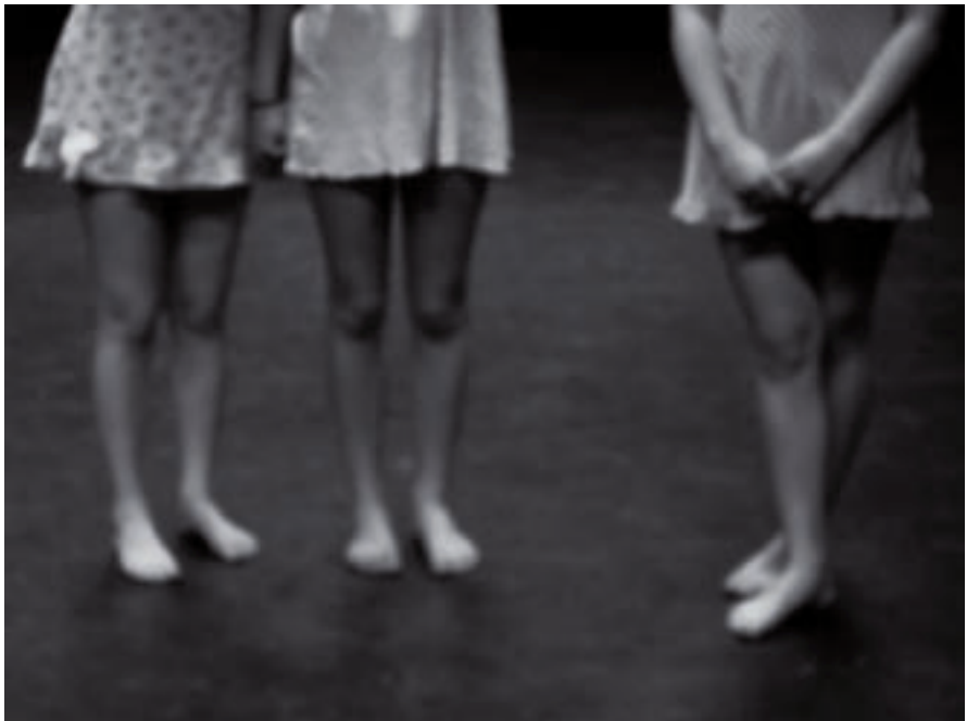
Evelyne Schuurman (3 de prijs WAK-fotowedstrijd)